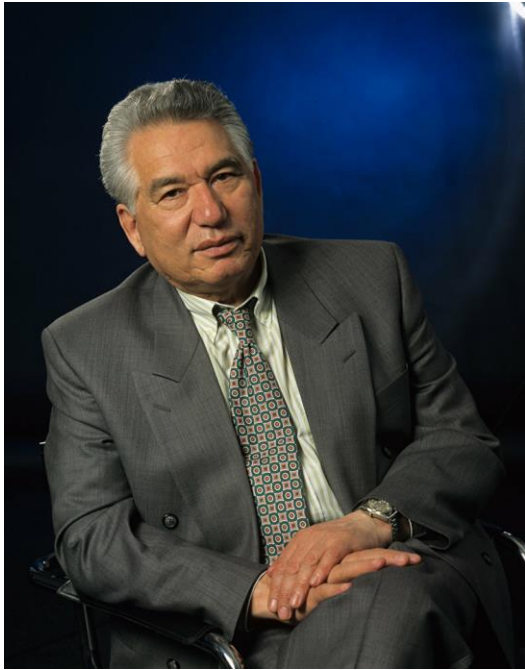
Chinguiz Torekúlovich Aitmatov (1928 – 2008)