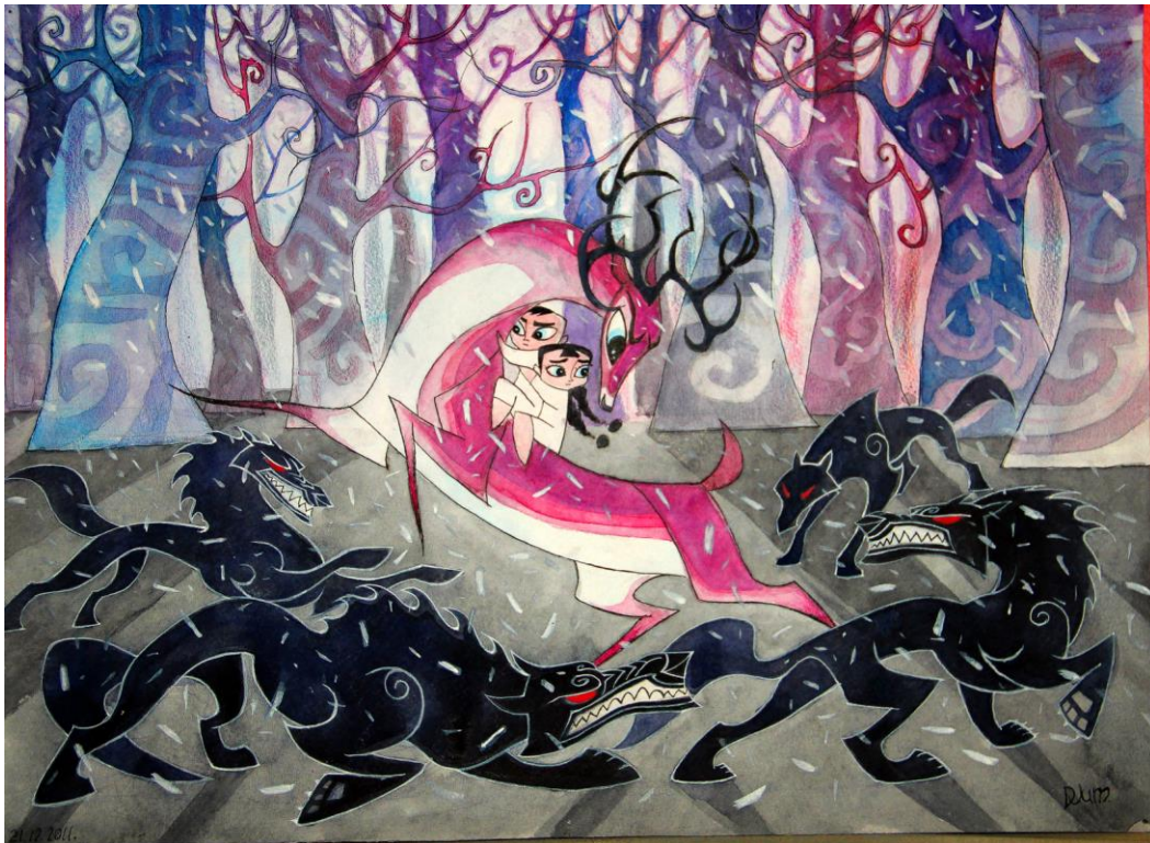
La madre del ciervo con cuernos – «El barco blanco»