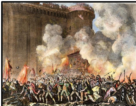
Annexe 1. Révolution française

La France est l'un des pays européens les plus beaux et les plus intéressants avec une histoire riche et un patrimoine culturel magnifique. Bruyant et bouillonnant comme une vague d'océan, ce pays a connu quatre révolutions aux 18 ème et 19 ème siècles. En même temps, la France était un modèle pour tous les grands hommes de la science et de l'art. Au 18 ème siècle, la Russie s'est activement