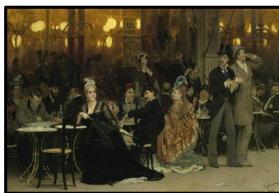
Annexe 4. Café de Paris (Ilia Répine)

Nikolaï Karamzine distingue chez les Français l'art de vivre et de s'entendre avec les gens, leur délicatesse, leur courtoisie et politesse. Dans ses notes on peut trouver les observations suivantes: «Personne