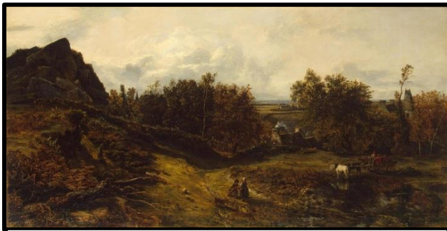
Annexe 5. Vue dans les environs de Granville (Théodore Rousseau)

En parlant de la France, on ne peut pas ignorer sa nature. Elle est assez diversifiée. Ici on peut trouver littéralement tout: plaines côtières, larges vallées fluviales entourées de collines pittoresques, chaînes de montagnes basses ( annexe 5 ). Sur le territoire français, il y a environ un millier de rivières et de fleuves sur lesquels se trouvent les grandes villes. Beaucoup d'événements