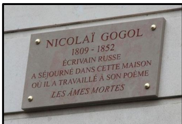
Annex 2. L'inscription de la maison où N.Gogol a séjourné

En 1789 , Nikolaï Karamzine , historien et écrivain russe, est parti pour un voyage à travers l'Europe qui a duré environ quatorze mois. Toutes les observations du pays, de ses habitants et de sa nature ont été présentées dans les