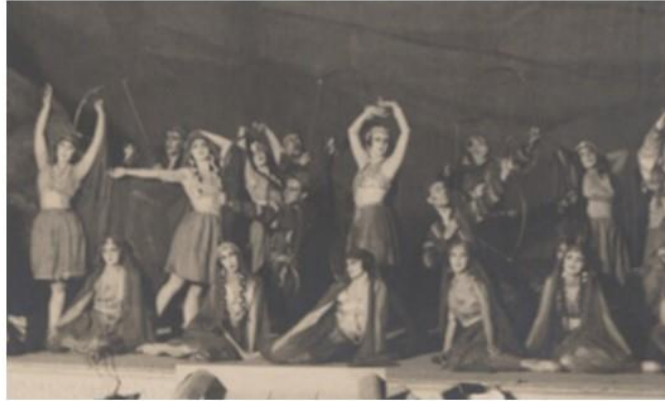
Image 7. Ballet «Les Danses polovtsiennes», opéra «Prince Igor», 1909