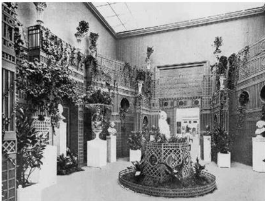
Image 2. Exposition de l'art russe au Salon d'Automne, Paris