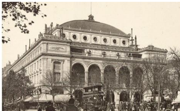
Image 5. Théâtre du Châtelet