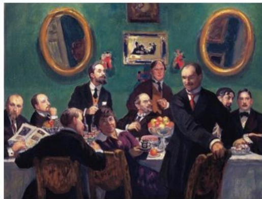
Image 3. B.Koustodiev «Portrait de groupe des artistes de la société «Mir Iskousstva» 1916-1920