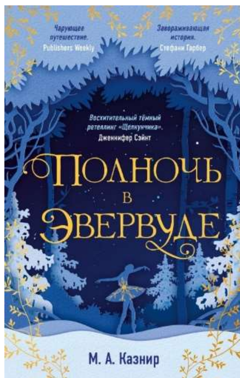
Le retelling « Casse-Noisette » Alexandre Dumas